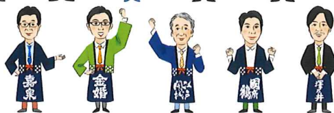
東京の酒蔵一覧 ※順不同